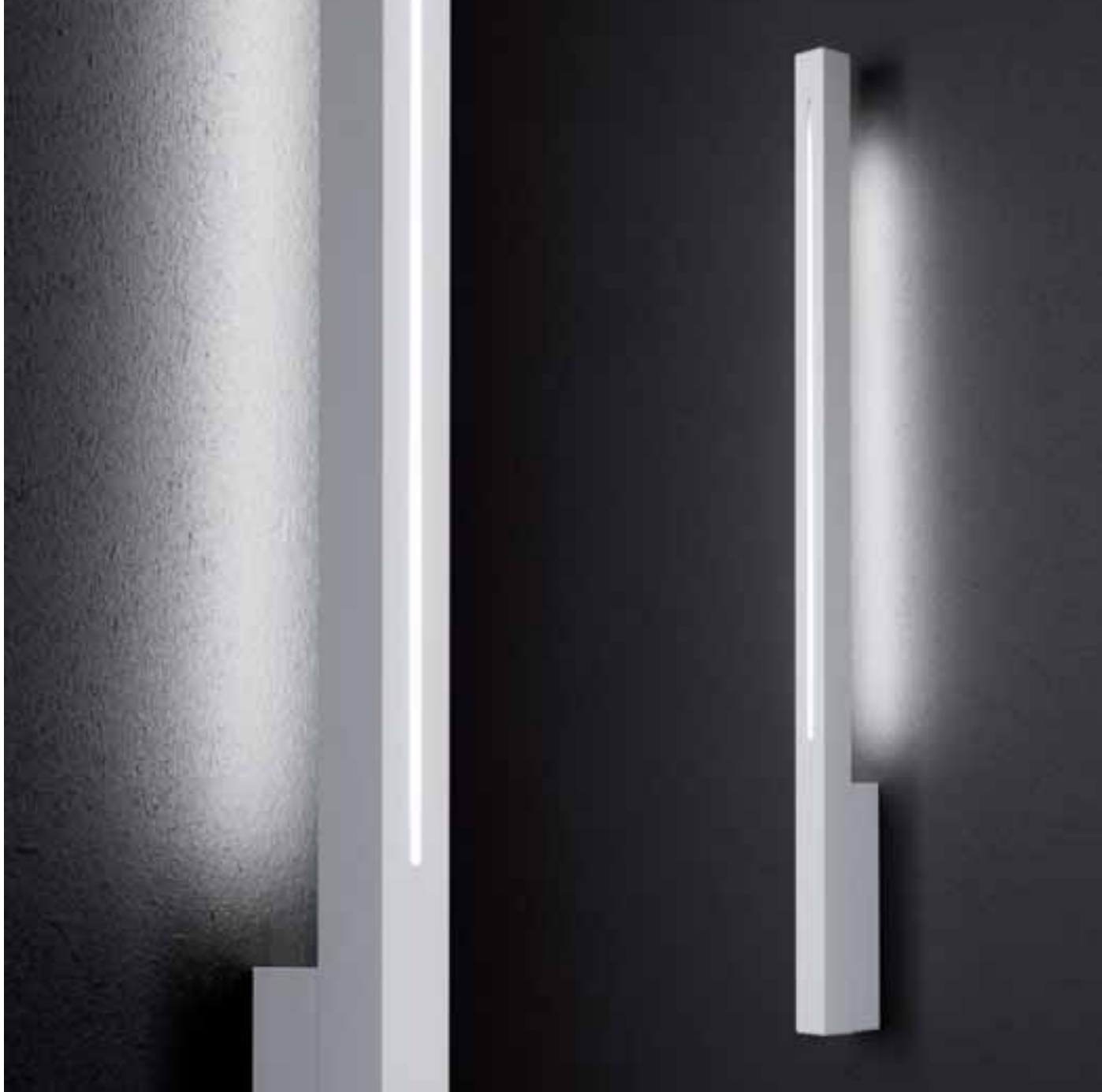
2107 T5 24W, G5